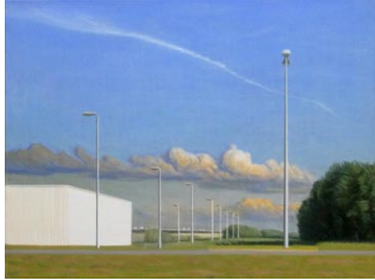
01. Peripherie (2013) 54 x 72 cm