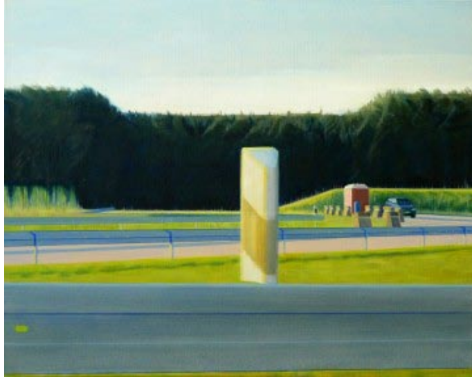
16. Gelbe Bake, dunkler Wald (2013) 72 x 90 cm