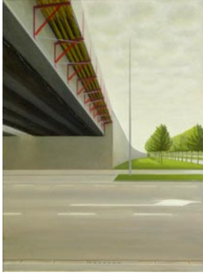
03. Neue Brücke (2013) 72 x 54 cm