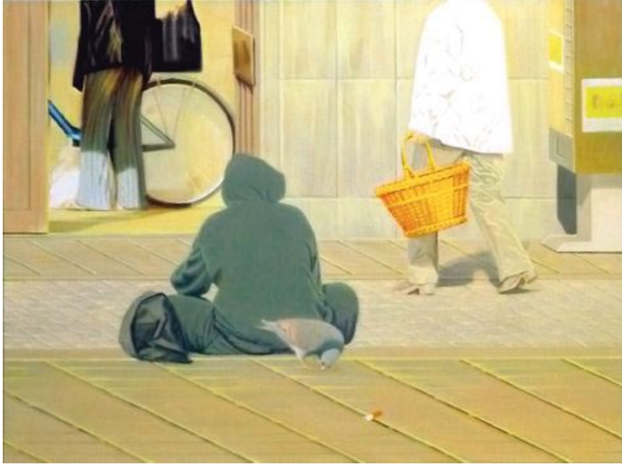
06. 150° zum Markt (2012) 90 x 120 cm