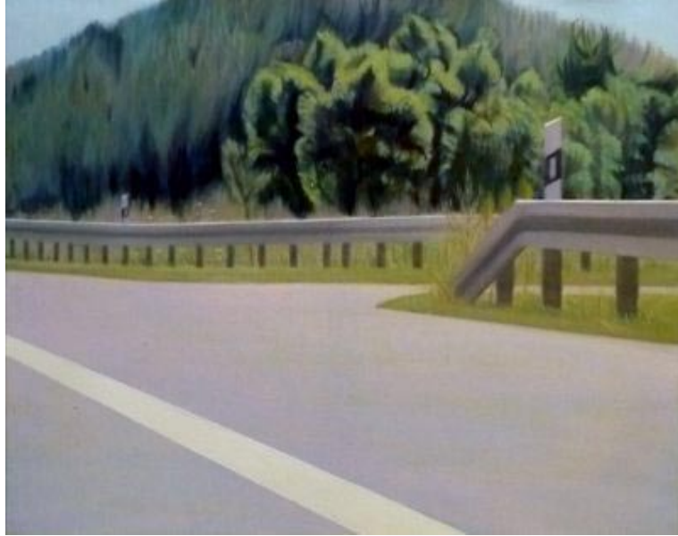
09. Wegmündung (2011) 80 x 100 cm