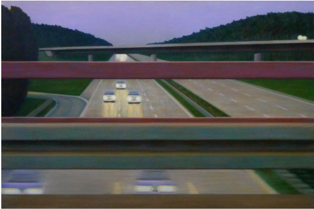
12. Dämmerung am Ring (2013) 90 x 135 cm